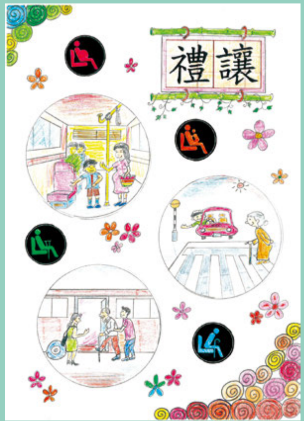
康嘉家（田景邨浸信會呂郭碧鳳幼稚園）

本校位於北區，跨境就學的學生人數約佔三成。因為鄰近深圳，所以不少跨境學生由三年級開始已選擇自行乘搭公共交通工具往返中港兩地。北區人流與貨流往來頻繁，而兩大主要鐵路的關口（羅湖、落馬洲）也正是跨境生每天必經之地，他們每天所遇上問題又豈止「跨境學童上學須知」可以解答得到呢！除了自身面對的問題外，這些小孩子每天更要面對不同的旅客，若他們不懂自處的話，恐怕問題就會很嚴重。