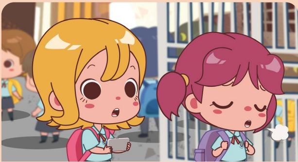
1 琪琪擔心自己的短片不受網民歡迎。

小啡豆和詩詩發現琪琪造假，你認為故事會如何發展？ 請進行小組討論，並將創作的結局畫在下方空格內，然後寫上創作對白。