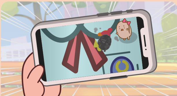
3 小啡豆和詩詩發現琪琪造假，立即前往公園找琪琪。